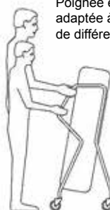
Chariot à livres « Transversal »

Poignée ergonomique adaptée à des utilisateurs de différentes tailles.